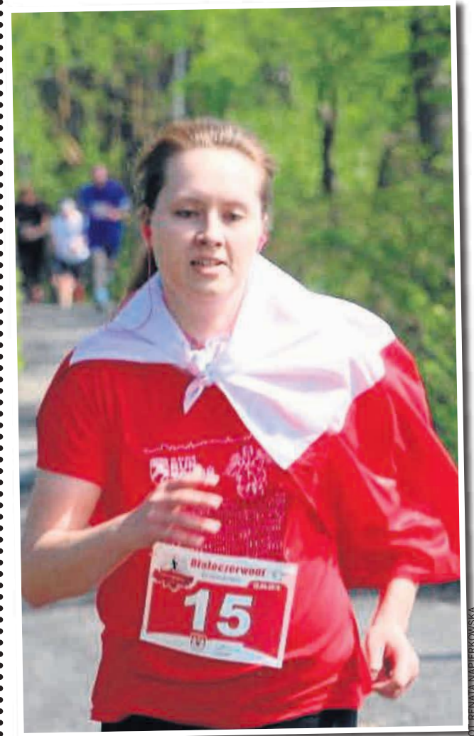
FOT. KRYSTYNA NAPIERKOWSKA

W 2017 roku trasę półmaratonu z Kruszwicy do Inowrocławia najszybciej pokonał Ukrainiec Roman Romanenko. W gronie kobiet najlepsza była Dominika Nowakowska. W Dyszce na Dyszkę triumfowali Ukraińiec Sergiej Fistowicz i Kamila Poblócka-Dobrowolska. ©