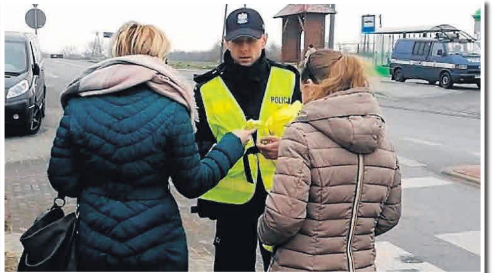
FOT. NASZE MIASTO

- Trzeba sobie zdawać sprawę, że przez takie zachowanie kierowca spowalnia reakcję na wydarzenia na drodze. Może też zbyt późno zauważyć przeszkody czy innych uczestników ruchu. Korzystanie z „komórki” może doprowadzić również do hamowania z opóźnieniem lub zbyt gwałtownego hamowania - mówi Izabella Drobniecka z KPP w Inowrocławiu. - Podczas jazdy nie należy korzystać z telefonu, gdy wymaga to trzymania słuchawki w rękę. Pamiętajmy o tym, gdy wsiadamy za kierownicę. (DM)