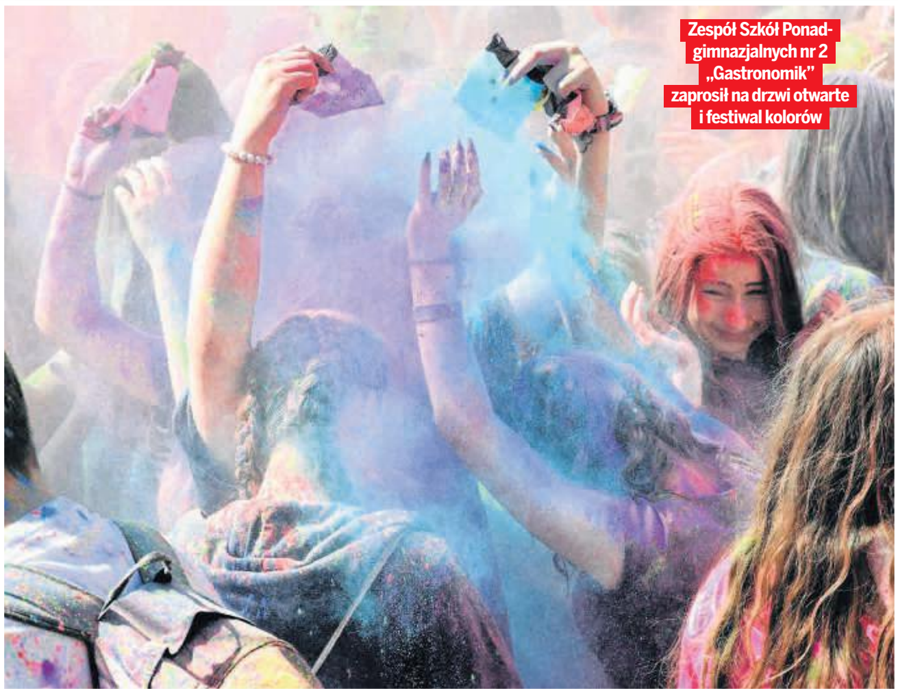
Zespół Szkół Ponadgimnazjalnych nr 2 „Gastronomik” zaprosił na drzwi otwarte i festiwal kolorów