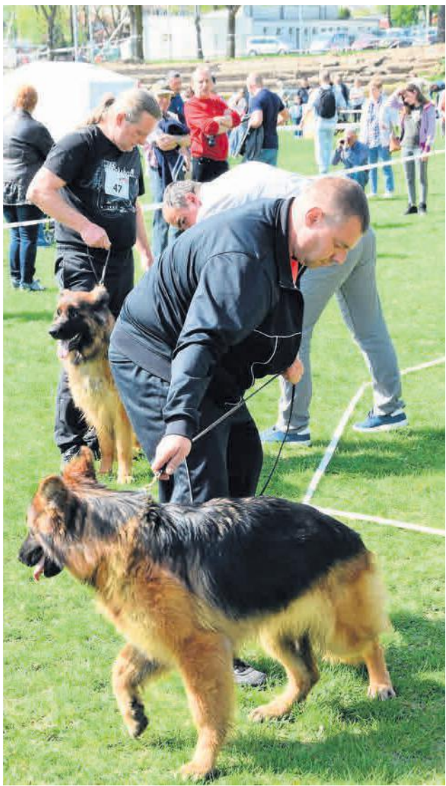
FOT. DOMINIK FIJAŁKOWSKI