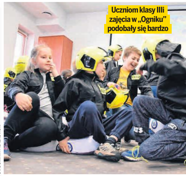
Uczniom klasy IIIi zajęcia w „Ogniku” podobały się bardzo

Zajęcia prowadzone są przez specjalnie przeszkolonych strażaków, w taki sposób, by jak najskuteczniej przemó-