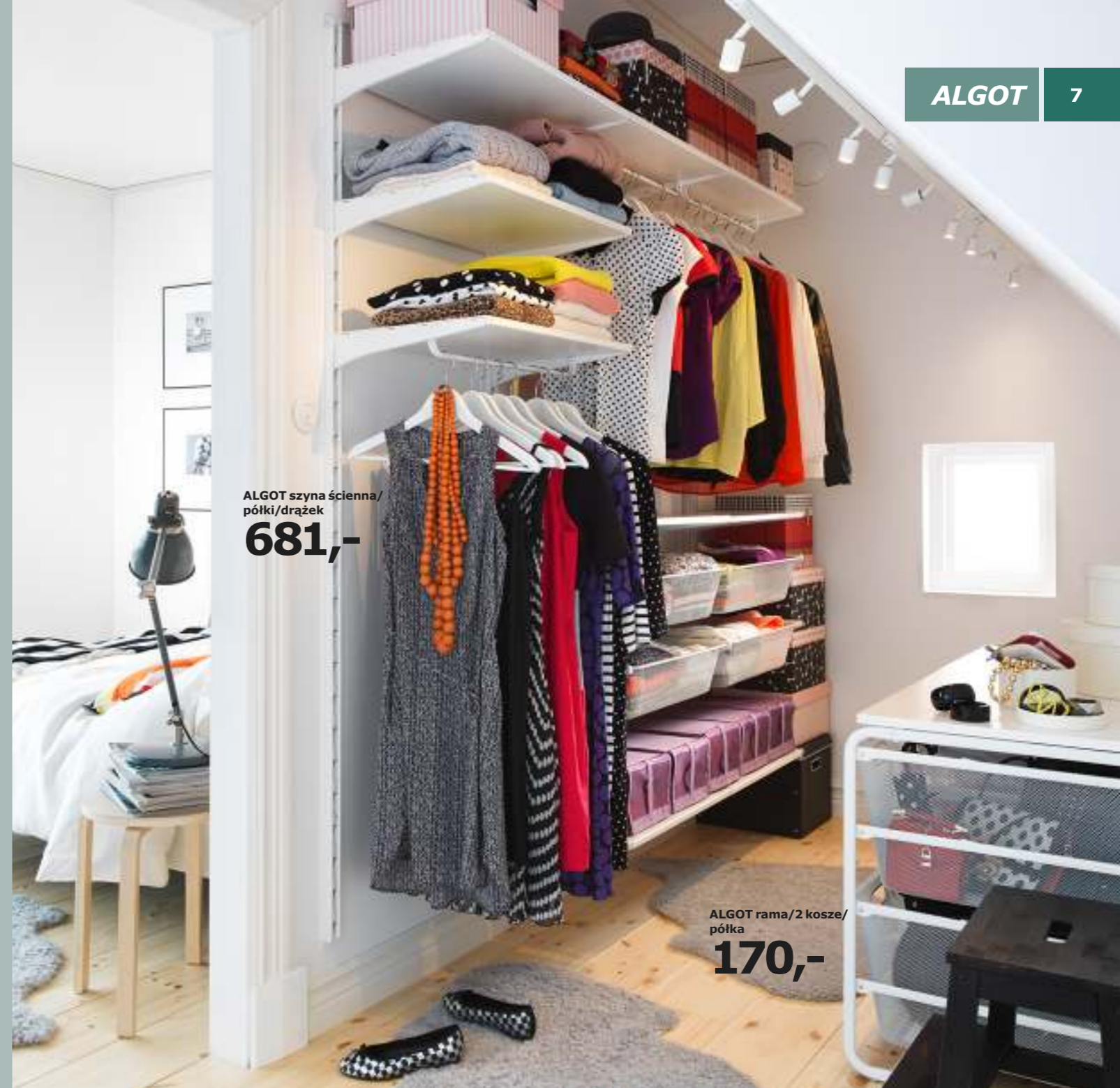
ALGOT szyna ścienna/ półki/drażek