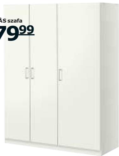
DOMBÁS szafa 379,99 W komplecie 5 półek i drążek na ubrania. Wykończenie z folii. S140×G51, W181cm. Biały 502.701.36