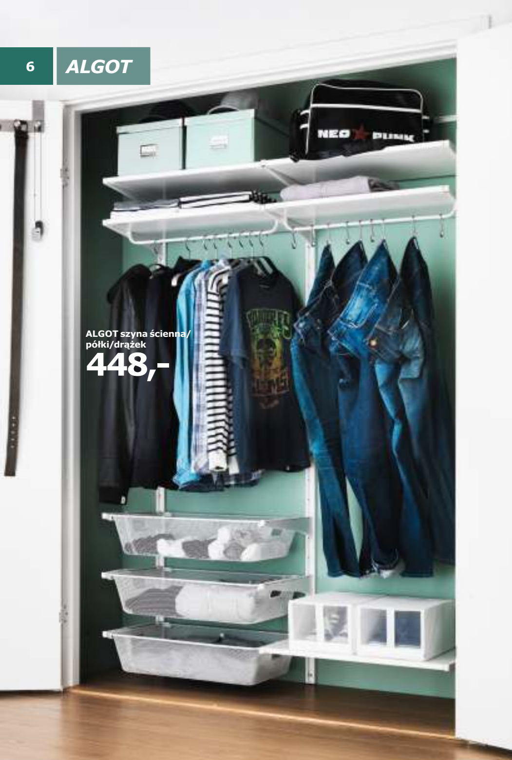
ALGOT szyna ścienna/ półki/drażek