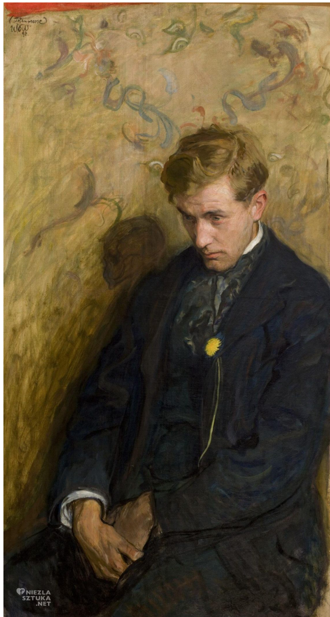
Wojciech Weiss, Melancholik , 1898, Muzeum Narodowe w Krakowie

Czy dzieło Wojciecha Weissa pt. „Melancholik” mogłoby stanowić ilustrację wiersza Kazimierza Przerwy-Tetmajera? Wyjaśnij na podstawie obydwu dzieł.