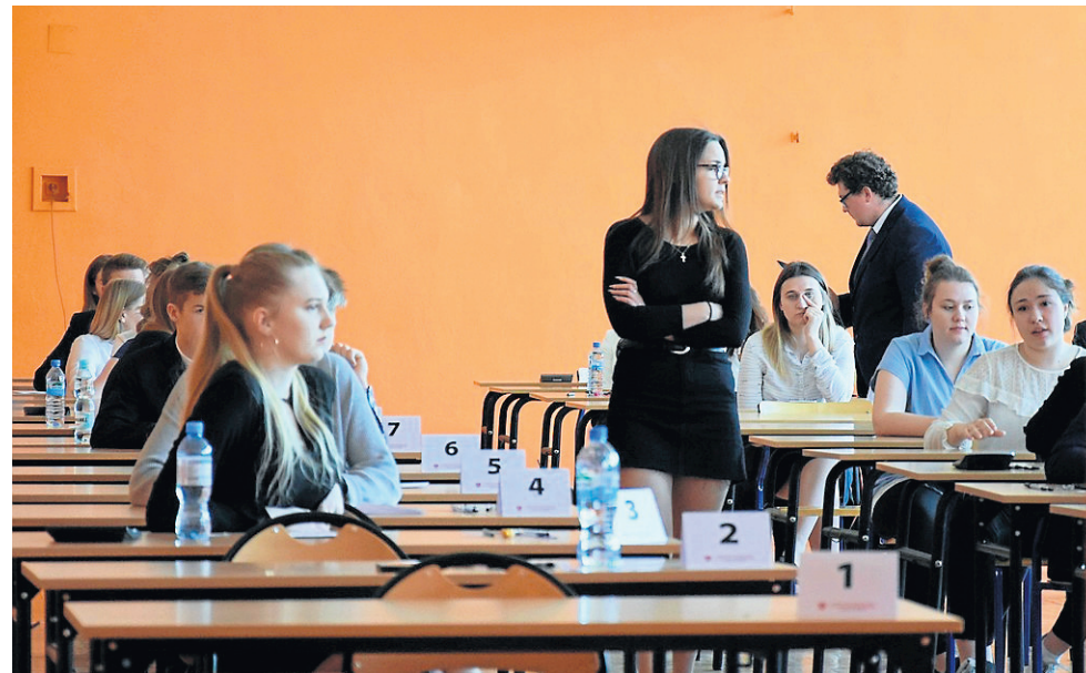
Tylko nieliczni nie zdali egzaminów. Maturzyści najlepsze wyniki uzyskali z języków obcych

Pozytywny wynik z tego przedmiotu uzyskało 97 proc. zdających (o cztery punkty procentowe więcej niż w regionie). W wiecborskim ogólniaku język polski zdało wszystkich 48 maturzystów na poziomie niecałych 51 proc., w sępoleńskim nie zdała tylko jedna na 44 zda-