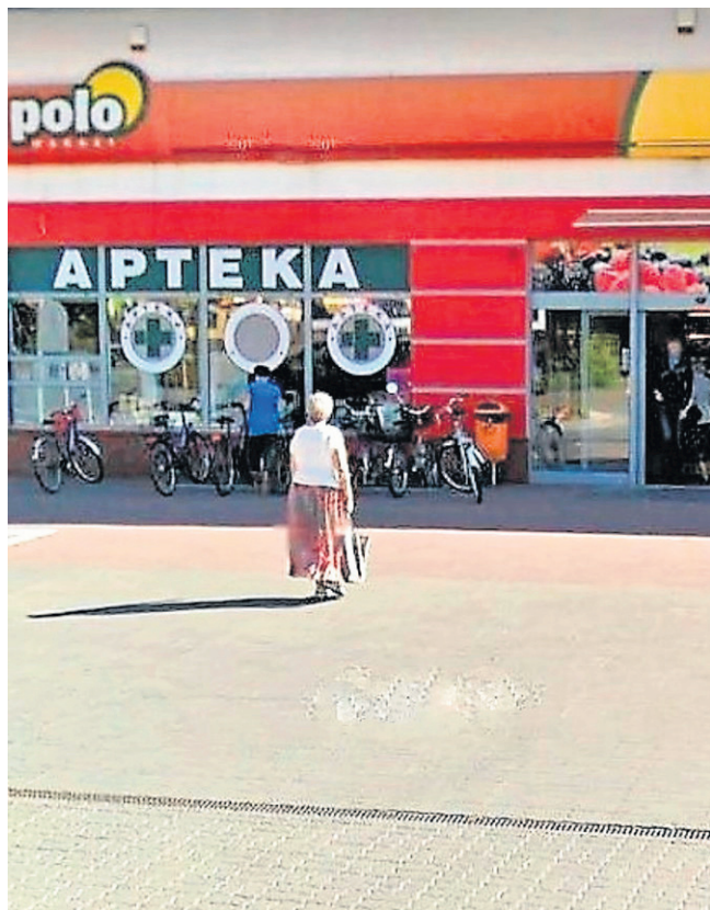
Problem z brakiem dostępu do całodobowych aptek w Sępólnie wynika m. in. z ich lokalizacji w markecie

Jedynie w Więcborku problem jest w pewien sposób rozwiązany. Tam właścicielka apteki przy ul. Ogrodowej 1 na życzenie klienta otwiera aptekę w nagłej sytuacji.