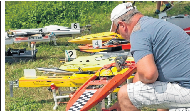
Podczas minionego weekendu Lińsk gościł 65 specjalistów z zakresu modelarstwa z całej Polski

Zapraszamy na Letnie Warsztaty Plastyczne na plaży w Cekcynie. Udział w nich może wziąć każdy mieszkaniec gminy i turysta przybywający w tym czasie na terenie gminy. Zajęcia potrwają do 19 lipca a także od 12 do 16 sierpnia od godz. 11 do 14. Można poznać tajniki tworzenia obrazów różnymi technikami malarskimi i na rozmaitych powierzchniach - szkło, ceramice. (RO)