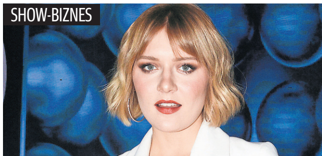
FOT. SYLVIA DĄBROWA