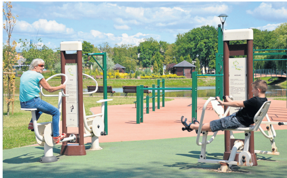
Siłownie terenowe to elementy osiedlowej infrastruktury, które powtórzyły się w budżecie

W Urzędzie Gminy będzie dostępna urna, karty do głosowania i regulamin. Głosy może oddać każdy mieszkaniec miasta i gminy Tuchola powyżej 16