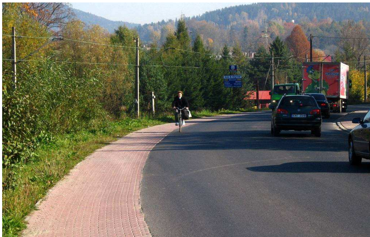
Rysunek 9. Tam, gdzie drogę dla rowerów wykonano z kostki betonowej, rowerzyści często pozostają na jezdni. DW 958 w okolicy Rabki.

Nawierzchnie z kostki betonowej są przedmiotem powszechnej krytyki jej użytkowników. Za nawierzchniami asfaltowymi oficjalnie opowiedziały się aktywne organizacje użytkowników rowerów, m.in.: Bractwo Rowerowe z Radomia 17 , Sekcja Rowerzystów Miejskich z Poznania 18 , Rowerowy Białystok 19 , Rowerowy Szczecin 20 , Rowerowy Toruń 21 , Rowerem do Przodu z Zielonej Góry 22 , Wrocławska Inicjatywa Rowerowa 23 , Zielone Mazowsze z Warszawy 24 , oraz ogólnopolska sieć Miasta dla Rowerów 25 . Nie są znane przykłady organizacji użytkowników opowiadających się za kostką betonową.