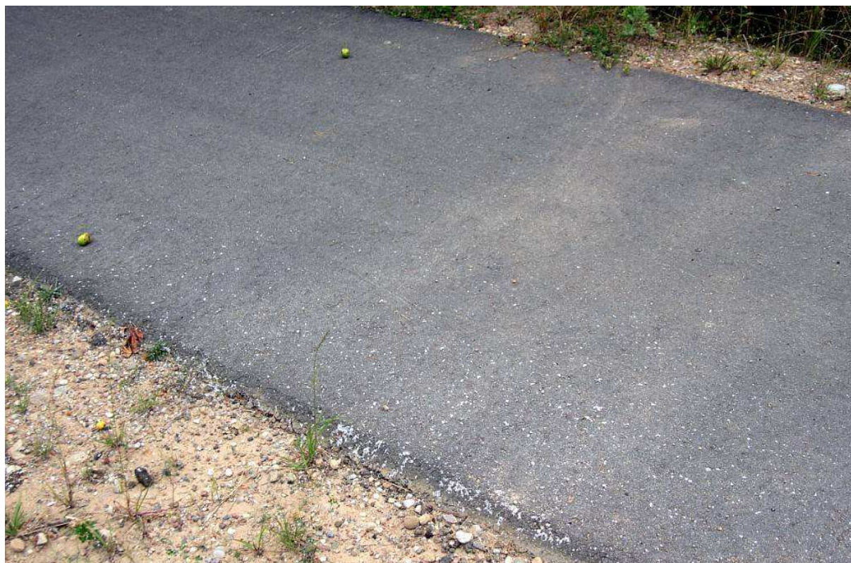
Rysunek 1. Wzorcowa nawierzchnia asfaltowa drogi dla rowerów wzdłuż DK 66 (okolice Czeremchy).