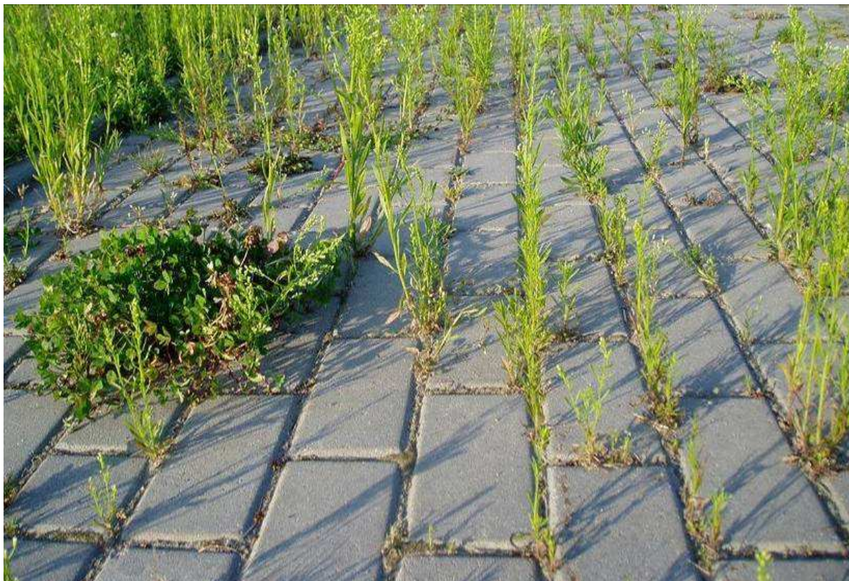
Rysunek 2. Utrzymanie dróg dla rowerów z kostki wymaga starannego usuwania roślinności ze szczelin pomiędzy kostkami. Przejście DK 61 przez Bargłów Kościelny.