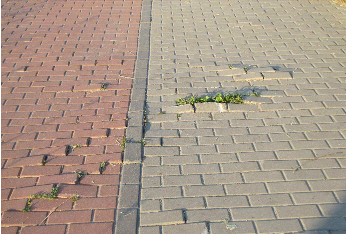
Rysunek 4. Nawierzchnia ciągu pieszo-rowerowego wzdłuż DK 13 po trzech latach od oddania do użytku.