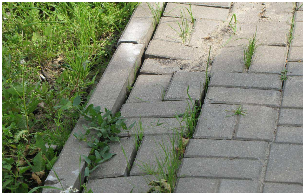
Rysunek 6. Tak często w praktyce wygląda odtworzenie nawierzchni z kostki betonowej po zakończeniu robót. DK 2 w okolicy Błonia.