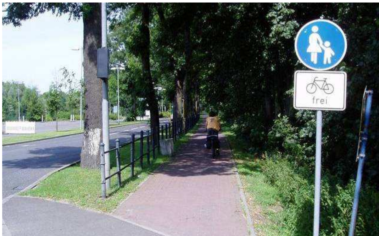
Rysunek 7. Ze względu na nawierzchnię z kostki betonowej ścieżka rowerowa wzdłuż drogi federalnej nr 166 (Niemcy) została przekwalifikowana na ciąg pieszy z dopuszczonym ruchem rowerów (bez obowiązku korzystania).