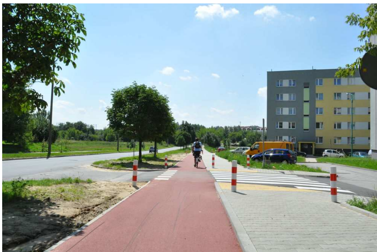
Rysunek 10. Wzorcowa nawierzchnia drogi dla rowerów z zachowaniem ciągłości na przejeździe przez wlot ulicy lokalnej. Radom, ul. Sycyńska.

Zarówno przesłanki funkcjonalne jak i ekonomiczne jednoznacznie wskazują na rozścielane mechanicznie nawierzchnie asfaltowe jako optymalne. Podnoszone okazjonalnie argumenty za kostką betonową nie zostały jak dotąd poparte jakimikolwiek twardymi danymi. Prawidłowo zaprojektowane i wykonane nawierzchnie asfaltowe są równiejsze, bezpieczniejsze, trwalsze, czytelniejsze dla użytkowników i tańsze od nawierzchni z kostki betonowej.