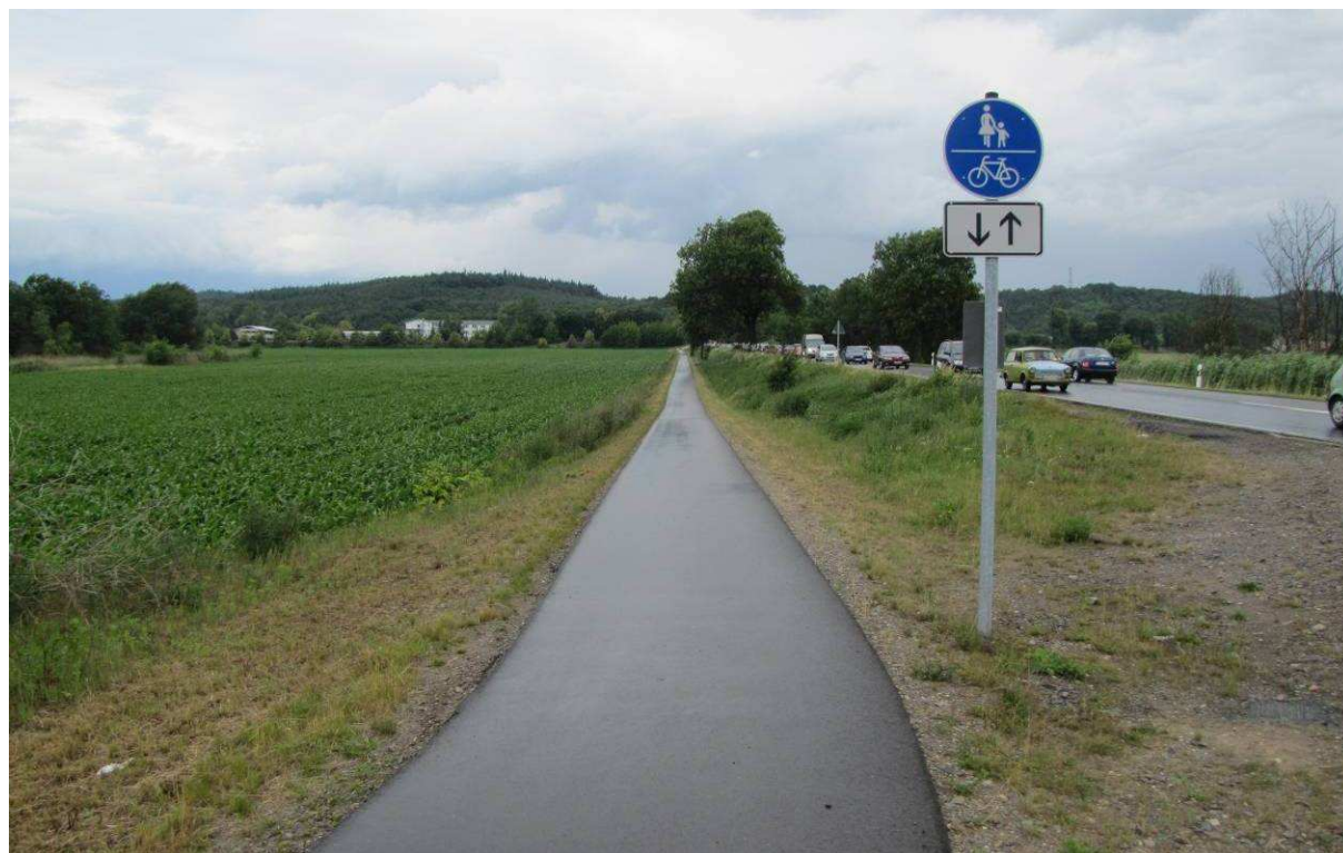
Rysunek 8. Nowe drogi dla rowerów i ciągi pieszo-rowerowe w Niemczech wykonywane są w technologii nawierzchni asfaltowej. Na zdjęciu droga federalna nr 158 w okolicy Bad Freienwalde.