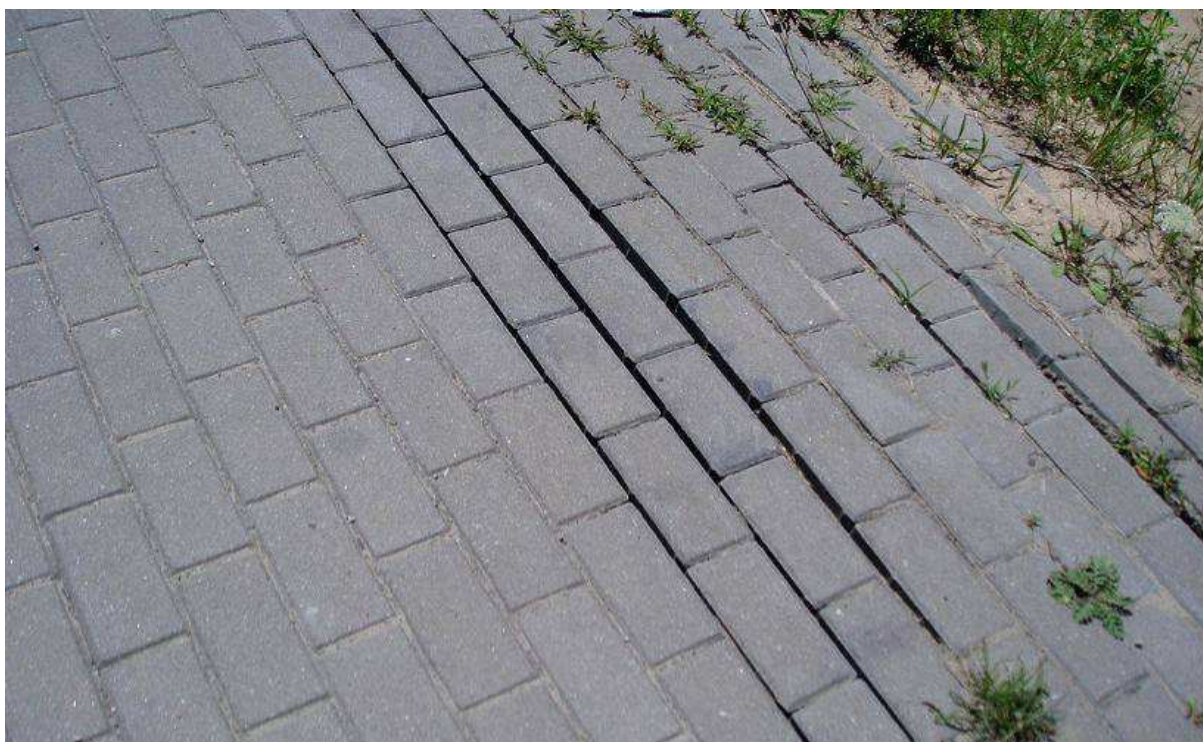
Rysunek 3. Typowe dla dróg z kostki szczeliny podłużne są niebezpieczne dla wąskich kół roweru. DK 61, Zegrze Północne.