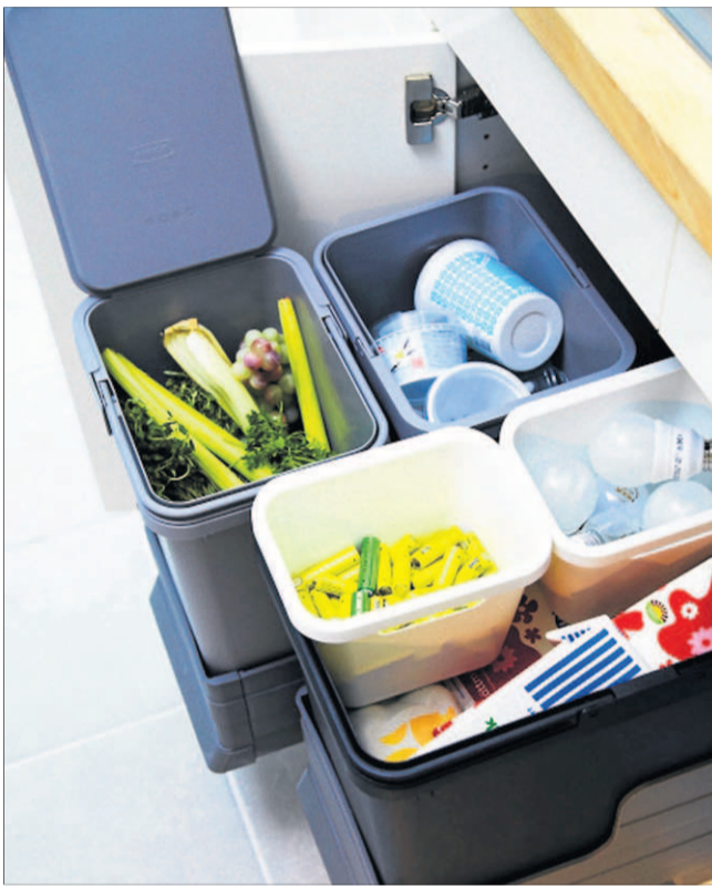
Recykling to coś, co każdy z nas może robić – od małych mieszkań po duże przedsiębiorstwa. Sortując odpady, sprawiamy, że surowce takie jak papier, plastik i metal mogą zostać ponownie wykorzystane do wytwarzania nowych produktów.

Dzięki zastosowaniu oświetlenia LED każde wnętrze nabierze niepowtarzalnego blasku, a rachunki... usuną się w cień! LAMPY LED świecą dłużej i jaśniej niż tradycyjne żarówki, a przy tym są trendy i zużywają ok. 85 proc. mniej energii. Barwa światła jest zbliżona do tej, jaką dają zwy-