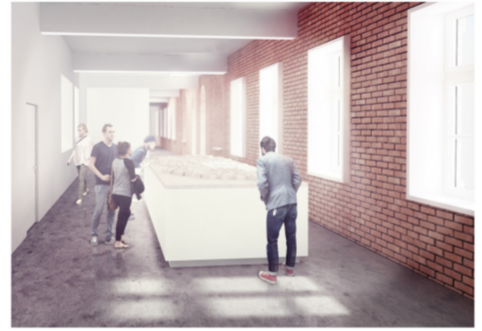
WIZUALIZACJA 1.2. HOLL WEJŚCIOWY ALTERNATYWNE WYKORZYSTANIE - MAKIETA MIASTA