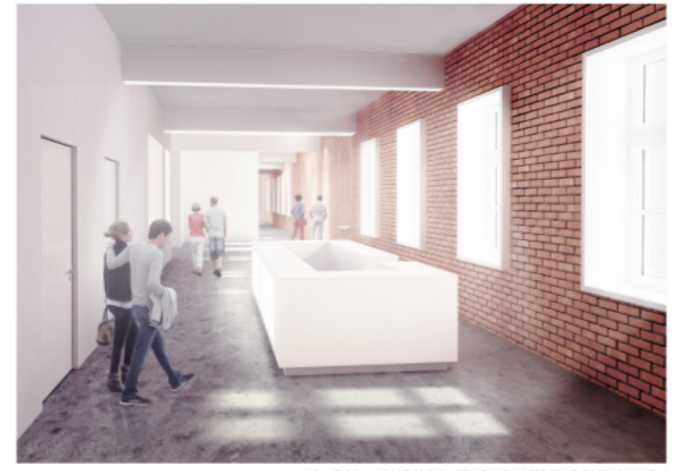
WIZUALIZACJA 1.1. HOLL WEJŚCIOWY ALTERNATYWNE WYKORZYSTANIE - SKLEPK Z KAWIARNIA