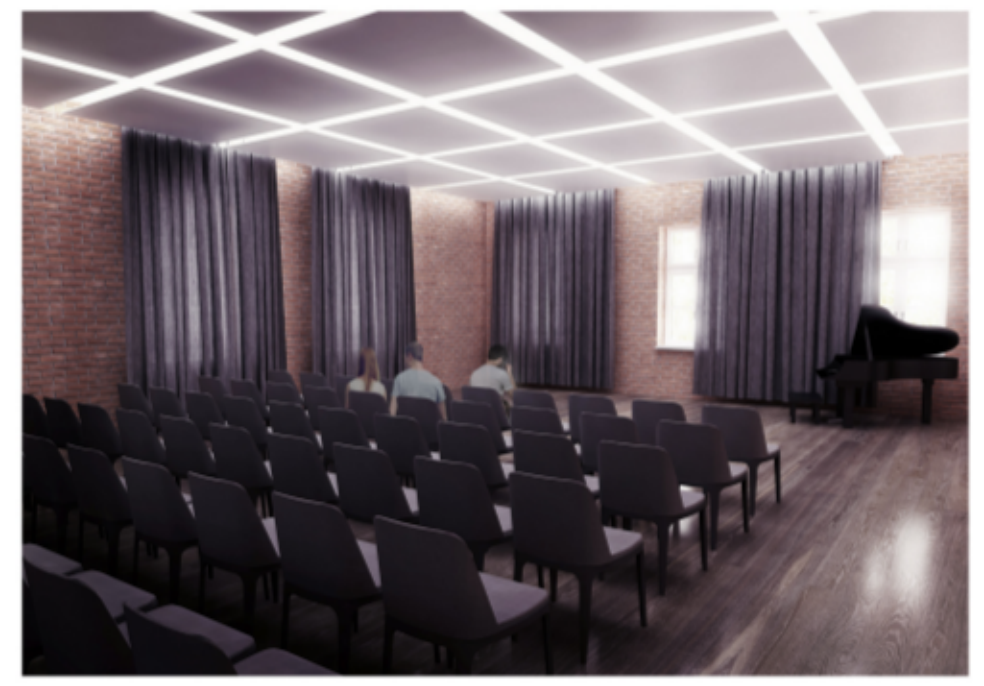
WIZUALIZACJA 2. SALA KONCERTOWO-WYKŁADOWA