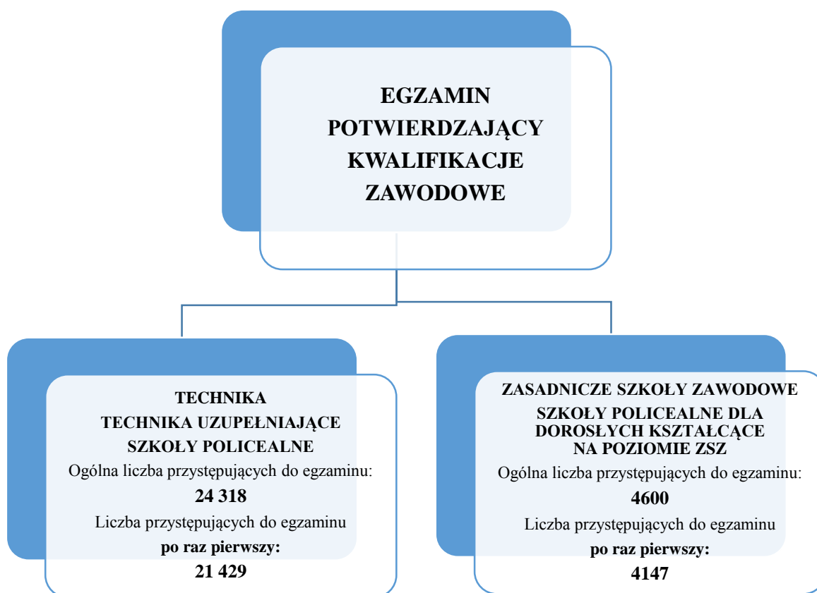
Schemat 1. Liczba absolwentów przystępujących do egzaminu zawodowego

Absolwenci technikum, technikum uzupełniającego oraz szkoły policealnej przystąpili do etapu praktycznego w okresie od 18 do 21 czerwca 2013 r., natomiast absolwenci zasadniczej szkoły zawodowej oraz szkoły policealnej kształcącej w tych samych zawodach, w których kształciła zasadnicza szkoła zawodowa – od 1 lipca do 9 sierpnia 2013 r.