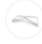
detal małej architektury ławka