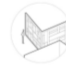
ściana wystawy zewnętrznej

Strefa wypoczynku oraz tablice wystawowe zostały umieszczone w rytmicznych, składowych geometrycznych form. Układy są otwarte i można swobodnie spacerować między poszczególnymi częściami wystawy.