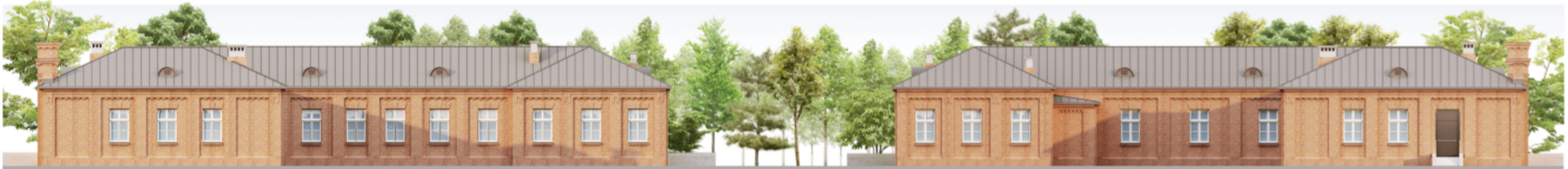
elewacja północna skala 1:100