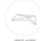
detal małej architektury formy zieleni