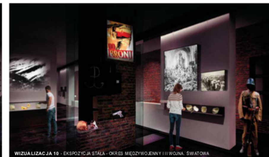
WIZUALIZACJA 10 - EKSPOZYCJA STAŁA - OKRES MIĘDZYWOJENNY I III WOJNA ŚWIATOWA