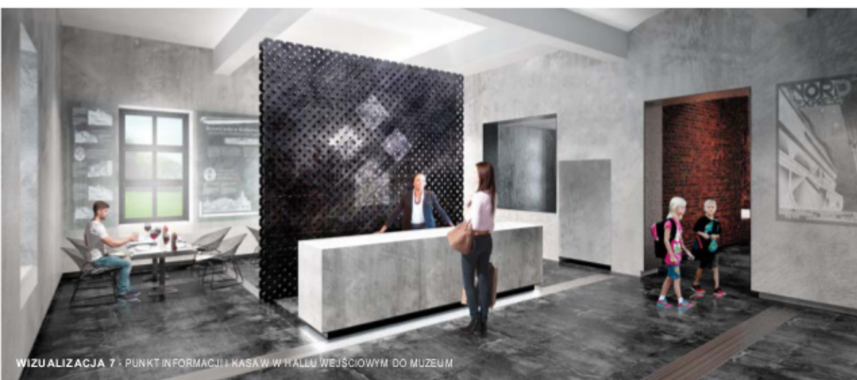
WIZUALIZACJA 7 - PUNKT INFORMACJI I KASA W HALLU WEJŚCIOWYM DO MUZEUM