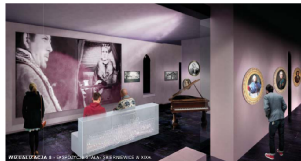
WIZUALIZACJA 8 - EKSPOZYCJA STAŁA - SKIERNIEWICE W XIXW.