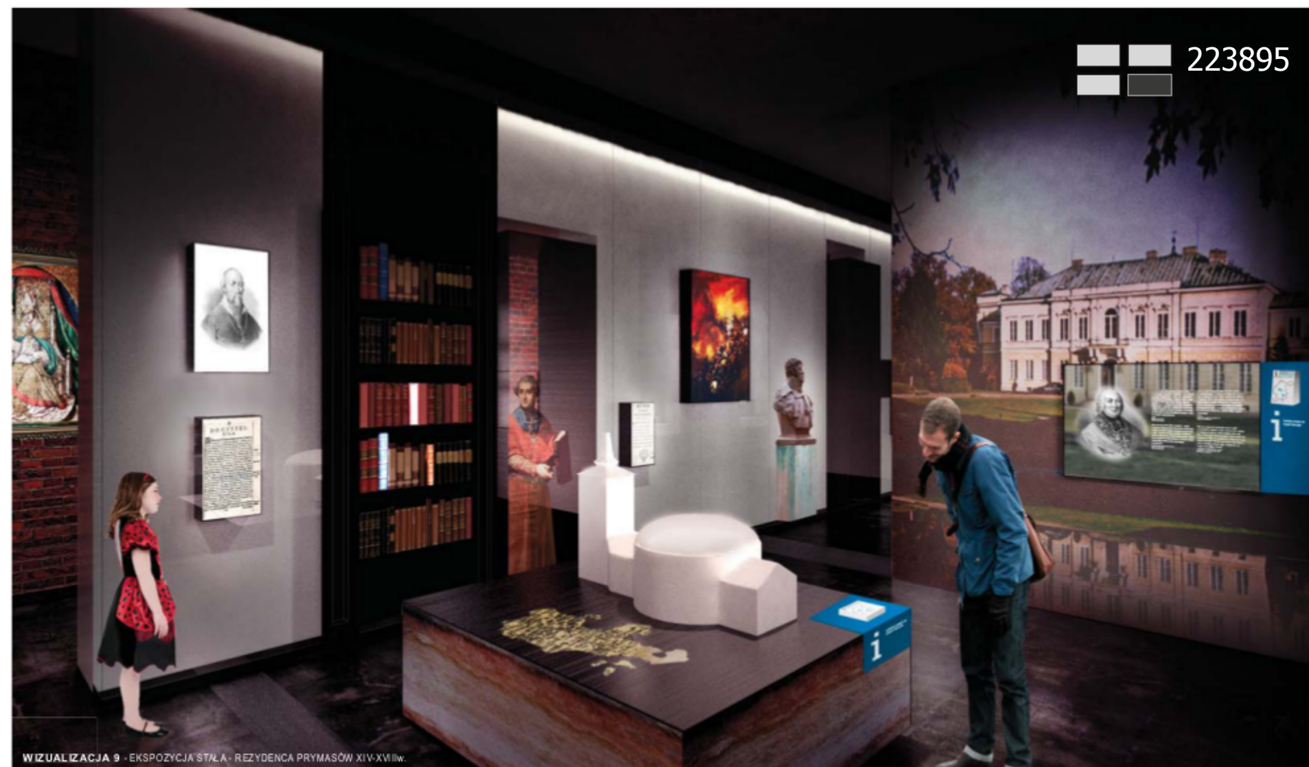
WIZUALIZACJA 9 - EKSPOZYCJA STAŁA - REZYDENCJA PRYMASÓW XIV-XVIIW.