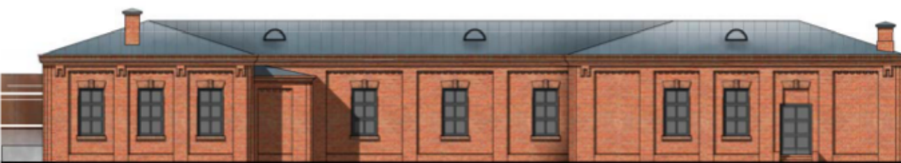
ELEWACJA TYLNA / ZACHODNIA | SKALA 1:100