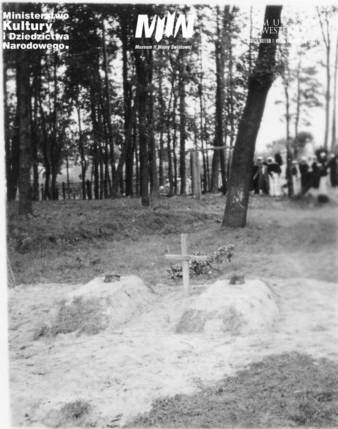
Fot. 3. Zdjęcie grobów wykonane w trakcie kolejnych wizyt marynarzy niemieckich na Westerplatte. Zwracają uwagę drobne różnice w szczegółach (por. fot. 1 oraz fot. 2) m.in. poprawiony krzyż, ułożenie czapek, itp. Zdjęcie wykonane w drugiej połowie września 1939 r.

Muzeum Westerplatte Dział: Muzeum II Wojny Światowej w Gdyni