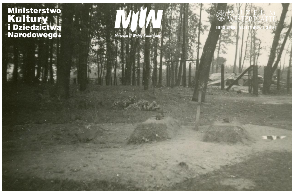
Fot. 1 i Fot. 2. Miejsce pierwotnego usytuowania jam grobów zbiorowych pochówków polskich żołnierzy, zlokalizowane przy Willi Oficerskiej. Zdjęcie wykonane po 10 września 1939 r.