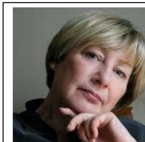
Ewa Lipska (ur. w 1945 r.) – poetka i felietonistka.

Mogę być sobą i sterować nocą by się w nietrwale nie zapuszczały lądy i pustej doby nie trzymać w ramionach. Myśli powtarzać by zostały po nas znowu dla kogoś. Dla tych samych odkryć.