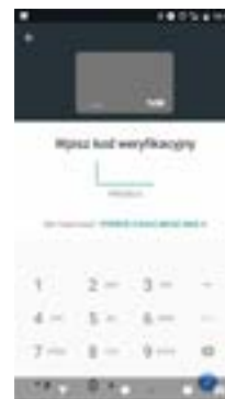
Potwierdź dane karty