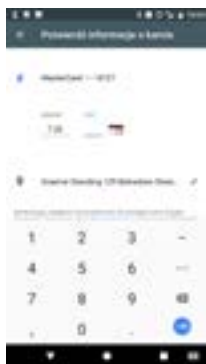
Potwierdź kod CVC