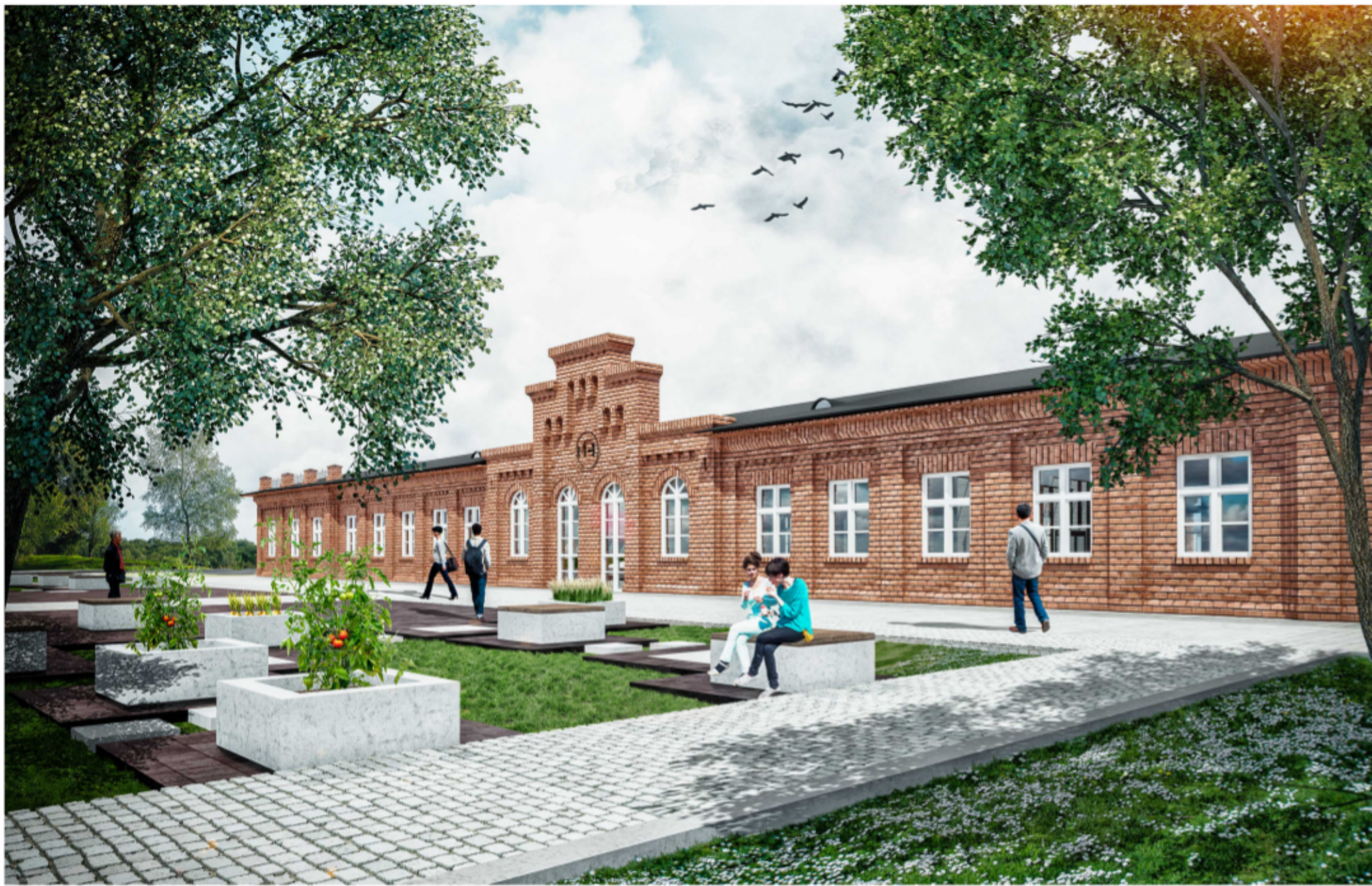
WIZUALIZACJA NA ELEWACJĘ FRONTOWĄ MUZEUM