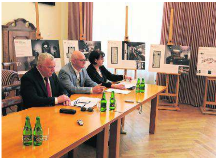
Konkurs na opracowanie koncepcji plastycznej ekspozycji stałej i pokazów multimedialnych dla Muzeum Twierdzy Toruń ogłoszono w styczniu bieżącego roku. Wyniki poznaliśmy 2 maja

Projekt jest zgodny z założeniami zawartymi w scenariuszu wystawy autorstwa Mar-