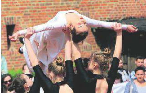
Uroczystości z okazji Dnia Flagi Rzeczypospolitej Polskiej

Dnia Flagi, który obchodziliśmy 2 maja, zorganizowano m.in. piknik patriotyczny i uroczystość wojskową. W czwartek 3 maja na starówce odprawiono mszę w intencji ojczyzny. (JM)