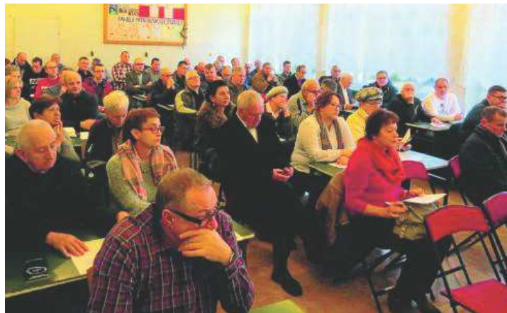
Jedno z pierwszych spotkań z mieszkańcami - zainteresowanymi przyłączem gazowym

Gazyfikacja objęte zostanie PEC (list intencyjny podpisany został w ub. roku). Każdy z mieszkańców będzie miał możliwość przyłączenia się do sieci gazowej, którą będzie dystrybuowała Polska Spółka Gazownictwa. Przy okazji tej inwestycji zostanie także przy-