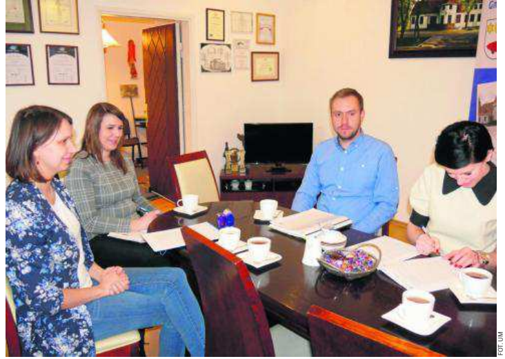
Umowa na modernizację Punktu Selektywnej Zbiórki Odpadów Komunalnych zlokalizowanego w Kowalewie Pomorskim została już podpisana

- Po modernizacji obiekt zyska ogrodzenie i utwardzony plac wyposażony w nowe kontenery na poszczególne frakcje odpadów. Powstanie budynek biurowy, budynek edukacyjny, punkt drugiego życia produktu, waga samochodowa. W pomieszczeniu edukacyjnym prowadzone będą zajęcia mające na celu podniesienie świadomości ekologicznej młodzieży na temat segregacji u źródła - informuje Karolina Kowalska, asystentka burmistrza Kowalewa.