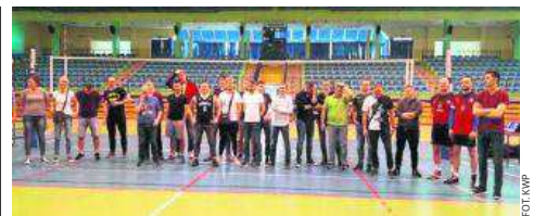
W rozgrywkach uczestniczyli m.in. policjanci z Rypina

Dokonano odbioru nowego odcinka drogi w Piotrkowie. Gmina Ciechocin zmodernizowała 995m trasy. Wykonano m.in. roboty przygotowawcze, podbudowę jezdni, położono nową nawierzchnię. - Przy drodze wykonano pobocza z kruszywa łamanego stabilizowanego mechanicznie oraz zjazdy. Na wspomnianym odcinku wykonano także elementy bezpieczeństwa ruchu drogowego w postaci znaków pionowych - informuje Urząd Gminy. Zadanie kosztowało 365 tys. zł, z czego 231 tys. zł stanowiła dotacja z Europejskiego Funduszu Rolnego. (KR)