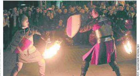
Nocny pokaz walk rycerskich z ogniem