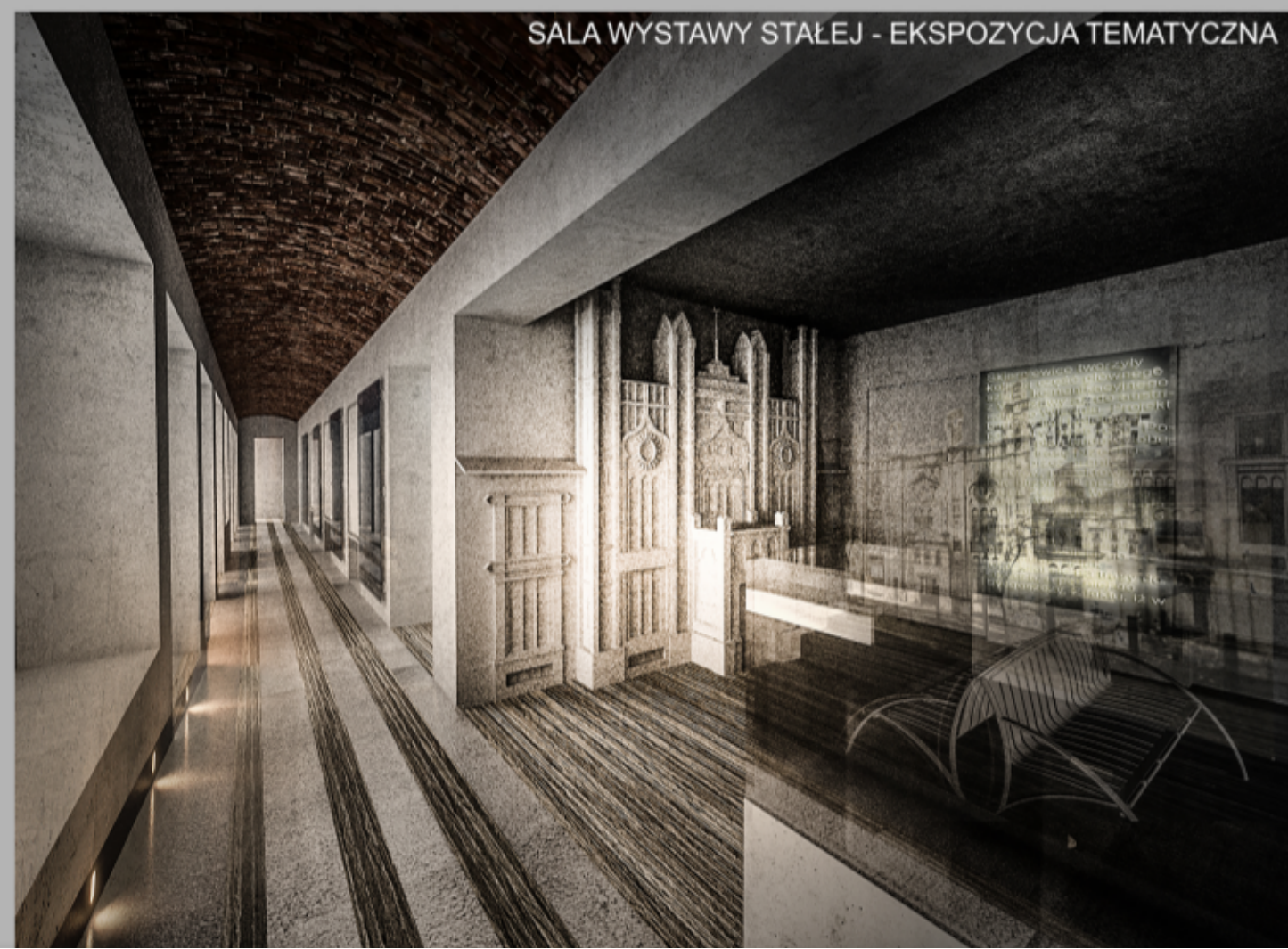
SALA WYSTAWY STAŁEJ - EKSPOZYCJA TEMATYCZNA