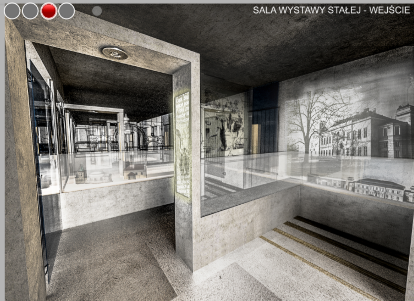
SALA WYSTAWY STAŁEJ - WEJŚCIE