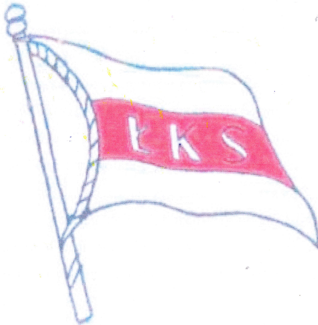
Grafika 1. Znak towarowy: TOW (210) 212921, (220), numer ochronny (111) 146344